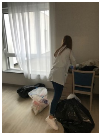
Les élèves d'Hélène Boucher

Ayant eu l'opportunité de travailler sur le projet de la réflexion sur l'architecture jusqu'à l'ouverture, la résidence répond aux attentes de tous.