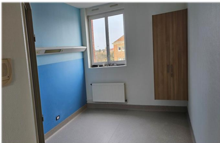
Chambre témoin et sanitaire (bâtiment A)

La phase 2 des travaux du bâtiment A (bâtiment principal) est en cours, la fin des travaux est prévue fin janvier 2024.