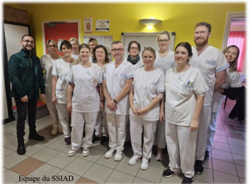
Equipe du SSIAD

Merci à nos aides-soignants de l'hôpital et du SSIAD, pour tout ce qu'ils accomplissent chaque jour.